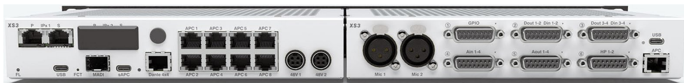
<XS3 IP CORE>