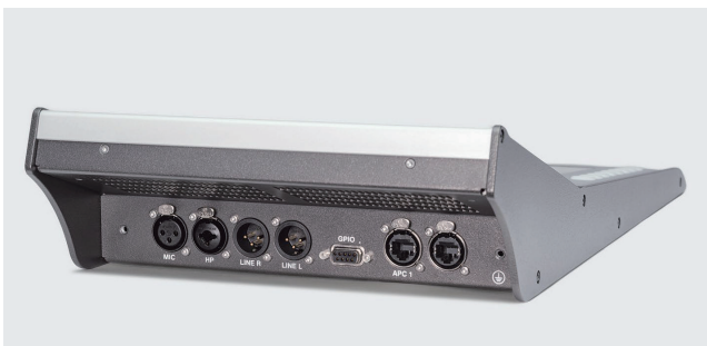
セントラルモジュール 背面図