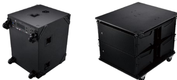
BRX325-SPは標準でキャスターを装備。

■ キャビネットには堅牢な合板を使用し、耐衝撃性に優れたDuraflex塗装でコーティングしています。