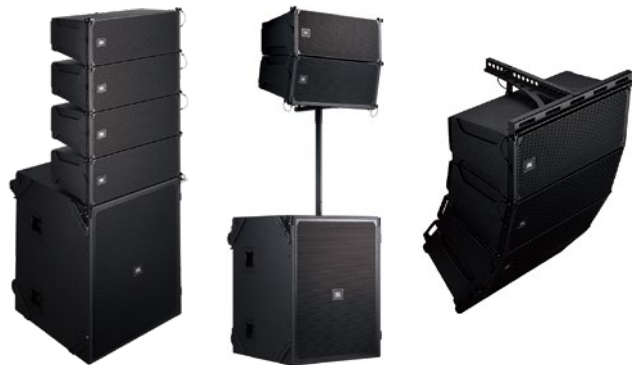
スタック、ポールマウント、フライングに対応。