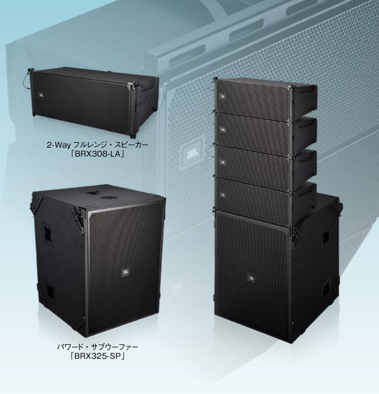
2-Way フルレンジ・スピーカー 「BRX308-LA」

BRX300 Seriesは、フルレンジ・スピーカー「BRX308-LA」とパワー・サブウーファー「BRX325-SP」で構成されています。BRX325-SPには、本体およびBRX308-LAを駆動するための高出力パワーアンプや必要な信号処理機能が全て内蔵されており、設置/接続するだけでセットアップが完了。定評あるJBLのラインアレイを気軽に導入できます。様々な設置方法に対応しコストパフォーマンスも優れているため、小～中規模のあらゆるPA現場で活躍します。