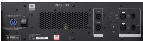
BRX325-SPの背面パネル。 1,000W×6chの高出力パワーアンプと必要な信号処理機能が全て内蔵されている。