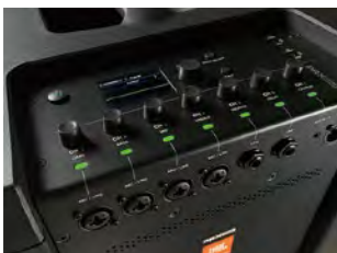
直観的に操作できるコントロールパネル