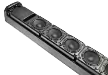
2.5インチドライバーを12個搭載

■ コラム部分には細部まで妥協せず開発した2.5インチドライバーを12個搭載しました。独自のAIM (Array Inumbration Mechanics) 技術で配置を最適化することで、個々のドライバー性能を十分に引き出しながら音の明瞭度と到達性を向上させています。