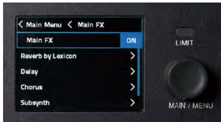
エフェクト設定ディスプレイ