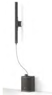
オプションの金具で壁への取り付けも可能