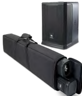
コラム部を収納するキャリングバッグが付属