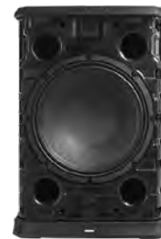
12インチウーファー