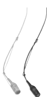
OVERHEAD ¥21,000 EZO/G ..... 色：チャコールグレー EZO/W ..... 色：ホワイト

Easyflex series は、優れた音響性能をコストパフォーマンス高く提供する設備用マイクロホンです。カートリッジには直径わずか 10mm のエレクトレットコンデンサ型を採用。定評ある SHURE の音響技術を継承した高品位設計です。幅広い周波数特性と優れた感度が目的の音をクリアに収音します。またマイクロホンの形状は、グースネック型、オーバーヘッド型、バウンダリ型(近日発売予定)の 3 種類を用意。会議室・学校・ホールなど、使いやすさやクオリティと同時に低コスト化が求められる場所に最適です。