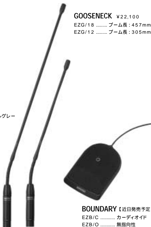
GOOSENECK ¥22,100 EZG/18 ..... ブーム長：457mm EZG/12 ..... ブーム長：305mm