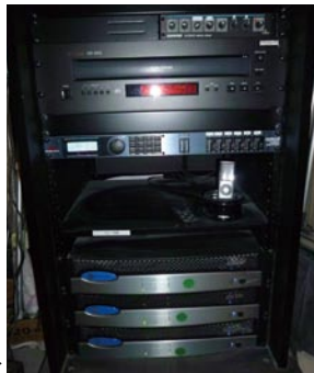
AMCRON のパワーアンプと dbx のプロセッサーが収納されたラック▶