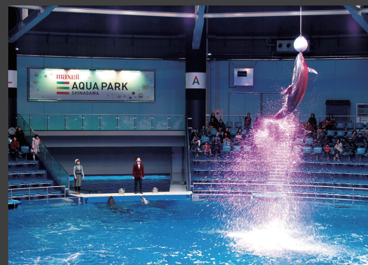
▲ 「ザ スタジアム」でのドルフィン・パフォーマンス。