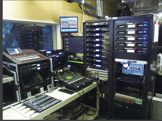
▲「ザ スタジアム」の調整室。モニタースピーカーには「AWC82」を使用。