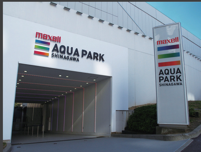
▲ 「マクセル アクアパーク品川」 エントランス。