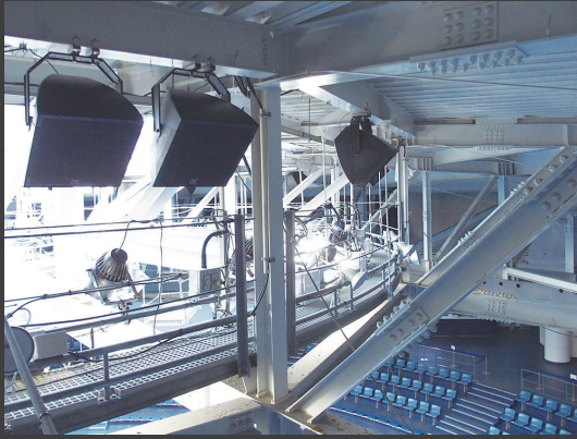
▲「ザ スタジアム」のプール上方中央から客席に向けて、「AWC159」が12本、「AWC15LF」が4本、円形状に設置されている。