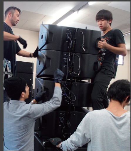
▲ 手際よく AiRAY を積み上げるスタッフ。 サブウーファー SCV-F の上に 4 台積み上げるのにかかった時間は、ものの数分。