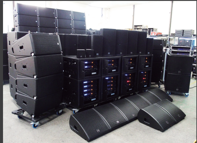
▲ CUE FOUR、LINUS RACK、D5-CUBE、G512 も勢揃い

「AiRAY の最大のメリットは『小さくて軽い』こと」と言い切ったのは、社長の東 威佐夫さん。「12 インチダブルなのに今まで使っていた 8 インチと横幅がそれほど変わらない。スタッフの負担が少なく、会社の経営者として考えた際、トランポや効率において小さくて軽いことは非常にメリットになる。もちろん音質もより良いクオリティを求めて他社製品と聴き比べ、スタッフの意見も聞いたうえで AiRAY に決めました。実際、片側 AiRAY × 5 + SC2-F × 1 のシステムをホールで使用した時も位相特性も優れていて、好みの音色を作れました。通常、花道が埋まるほどのステージ脇のスタックも AiRAY を使うと十分なスペースができ、ほんとに小さくて信じられない思いでした。それでいて二階席奥まできちんと音は届いています。AiRAY を使用するとクライアント様には必ず喜んでいただいています。」と話してくださいました。