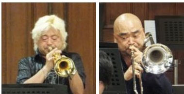
▲トランペットとトロンボーン用の "4099T" ホーンセクションの 12 人全員に取り付けられました。