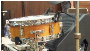
▲ドラムのスネアを狙う DPA "4099D" タムにも 4099D がそれぞれ取り付けられ、ドラムだけで合計 5 本の 4099D が使用されました。