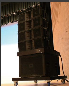
◀舞台の左右に設置された「VT4886」×4本 + 「VT4883」×1本のセット。シネマ上映時はL/Rのスピーカーとして使われる。