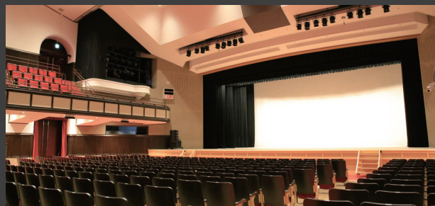
▼大ホールの舞台と客席。リニューアル後も開館当時の趣のある雰囲気を保っている。