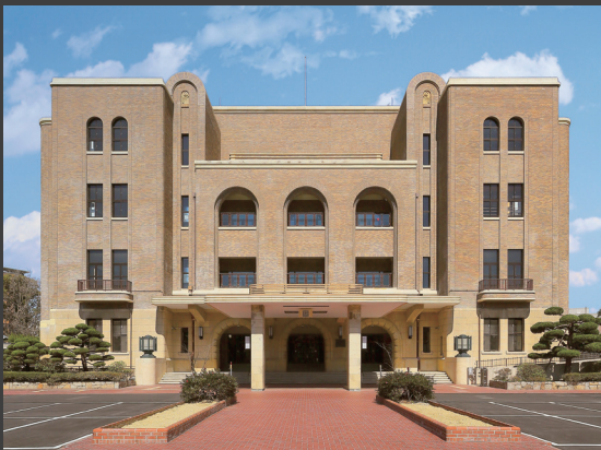
▲「名古屋市公会堂」外観。歴史的価値の高い外観はそのままに、リニューアル・オープンを果たした。