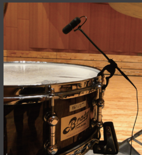
◀ DPA Microphones d:vote V04099 のセット[V04-Rock]と[V010-Classic]を使用したマイクセッティング