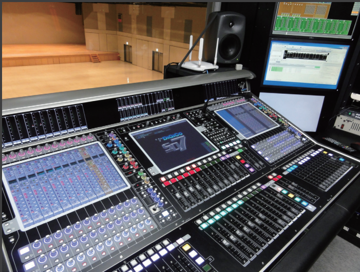
▲中ホール コントロールルームの DiGiCo「SD7」