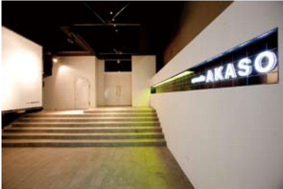
白を基調にしたシックな外観

ライブハウスの枠を超えたエンターテインメント発信スペースに 高品位なデジタルコンソールを導入