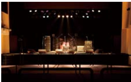
スタンディングで 700 名収容のホールとステージ